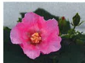
アオイ科フヨウ（芙蓉）属 別名：コットンローズ