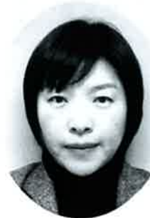
産業保健相談員 (メンタルヘルス)