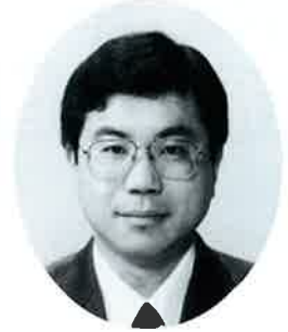
産業保健相談員 (産業医学)