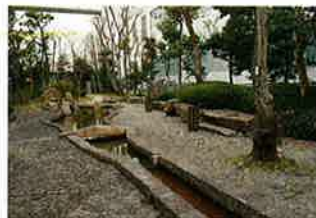
中庭に設けられた喫煙所。今後は非喫煙者の通行が多い喫煙所を廃止し、建物から離れた場所に集約することも検討中