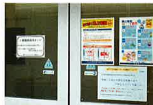
喫煙所には、喫煙マナーに関する注意書き、啓発のチラシで、路上喫煙の防止や非喫煙者への心配りを訴える