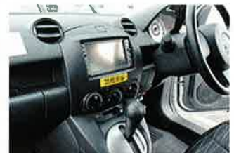
全面禁煙に先立ち禁煙化された社用車。「禁煙車」のステッカーが貼られる