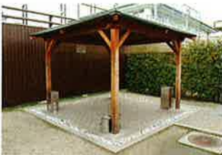
東屋風の屋外喫煙所。平成20年度に設置場所を検討したうえで予算化し、全面禁煙に合わせ完成させた。敷地内にはこの喫煙所を含め、屋外喫煙所が数カ所設置されている

ここでは全面禁煙へ移行した事業場の例をご紹介します。敷地内に事務棟や工場が点在するこの事業場では、平成21年10月1日付で建物の各フロアに設置されていた喫煙スペースを廃止、喫煙は屋外と建物屋上の喫煙所に限定する、全面禁煙に踏み切りました。それに先立ち、平成19年度以降、社用車の禁煙化、たばこ自販機の撤去などハード面の対策と並行して、禁煙教室の定期的な実施、産業医による禁煙相談、ニコチンパッチの無料配布など禁煙支援活動も積極的に展開、その結果平成19年度には26.8%だった喫煙率が、平成22年度には20.2%へと減少しました。喫煙者に対し受動/能動喫煙の害を周知し、意識改革・行動変容へと結び付けたことが、成功の秘訣といえそうです。