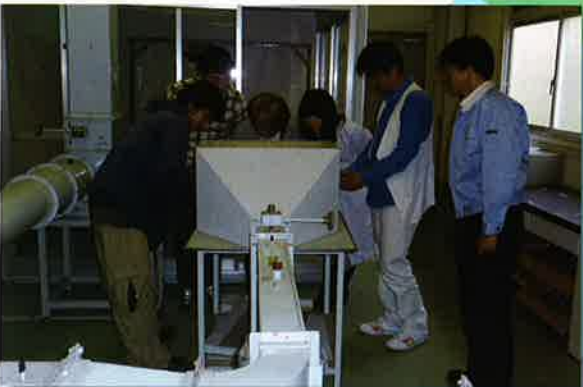
作業環境管理実習