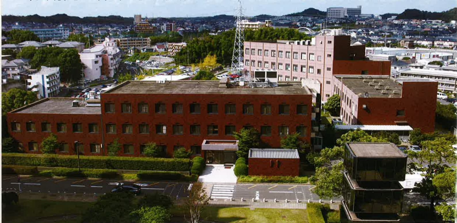
産業生態科学研究所全景

「産業医学基本講座」は、産業医学と産業医活動に関して、短期間で体系的に履修できる国内唯一の専門研修です。