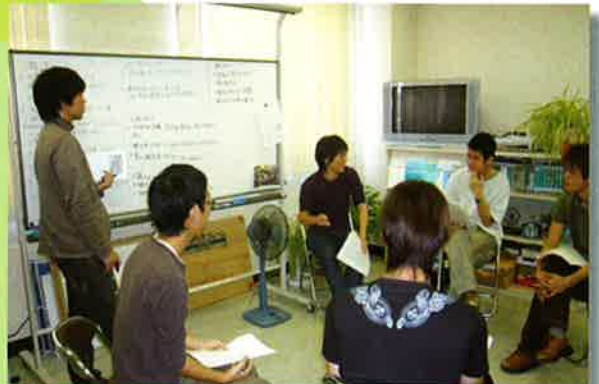
メンタルヘルス実習