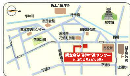
地図: 熊本産業保健推進センター所在地